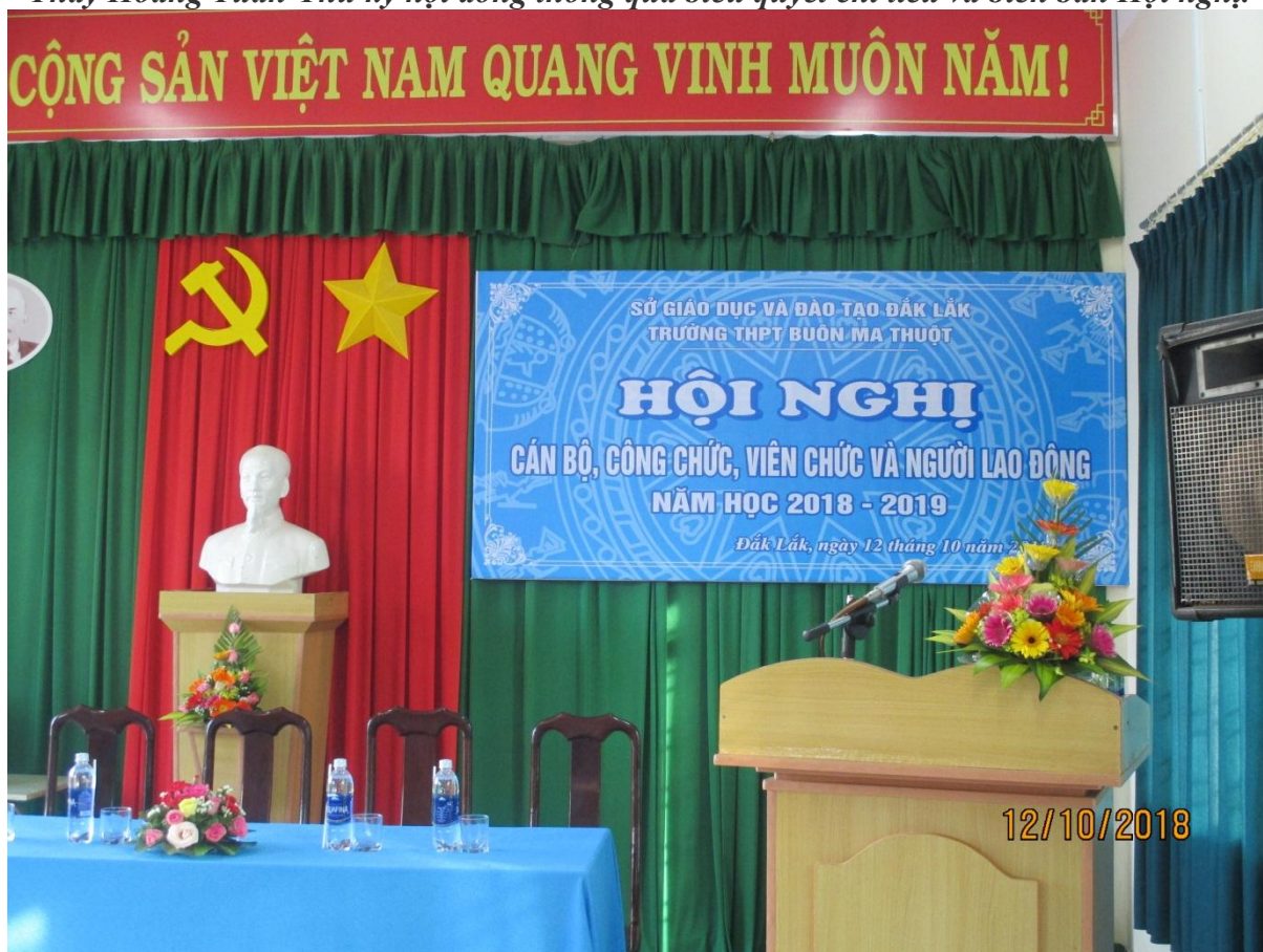
HỘI NGHỊ KẾT THÚC-THÀNH CÔNG THEO KẾ HOẠCH