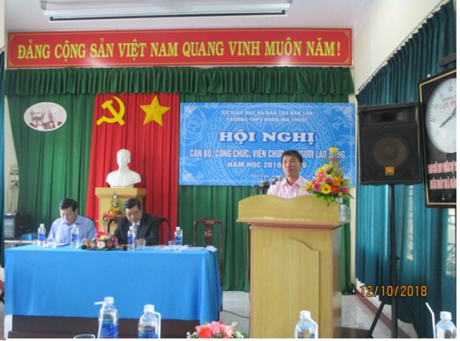
Khen thưởng các tập thể và các cá nhân đạt thành tích cao