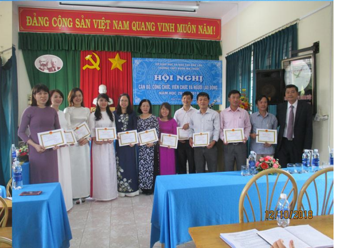
Khen thưởng các tập thể và các cá nhân đạt thành tích cao